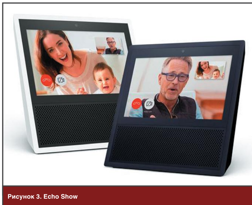
Рисунок 3. Echo Show

Кроме того, вы можете настроить определенные контакты для автоматического входа, перейдя на вкладку Conversations в приложении Alexa, щелкнув значок «Контакт». Основываясь на списке ваших контактов из телефона, Alexa перечислит всех, у кого есть Echo, связанный с их номером телефона, и вы просто установите переключатель Contact Can Drop In Anytime в положение On. Только помните, что включение данного параметра означает, что контакт может в любое время получить доступ к вашим устройствам Echo, зайти в них и послушать или «поговорить» с ними.