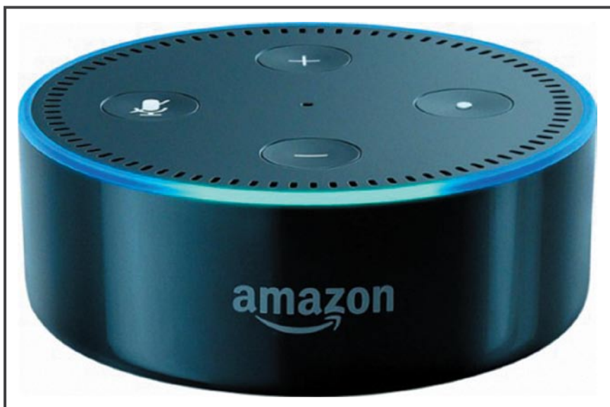
Рисунок 1. Amazon Echo

Проверьте настройки Drop In. В июне 2017 года у голосового помощника появилась новая функция Drop In, которая работает во всех устройствах Echo, включая Dot и Show. Функция Drop In позволяет Echo автоматически подключаться к другому Echo, чтобы начать диалог. Другой стороне даже не нужно выбирать вызов: линия открывается и начинает работать автоматически.